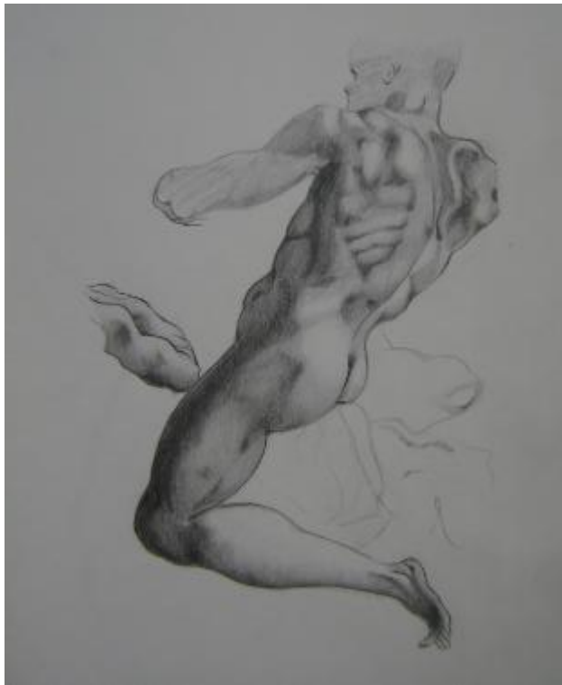
Dibujo de Christopher Mercado'09