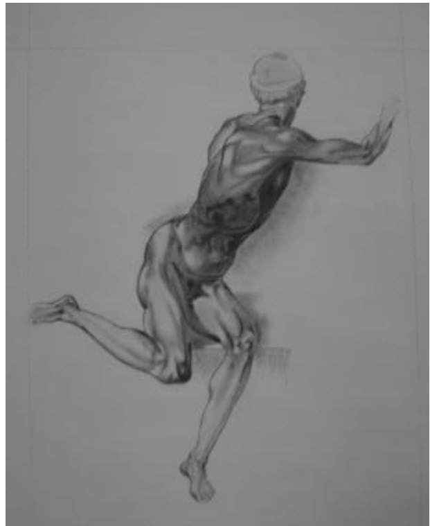
Dibujo de Nashma Rodríguez'09