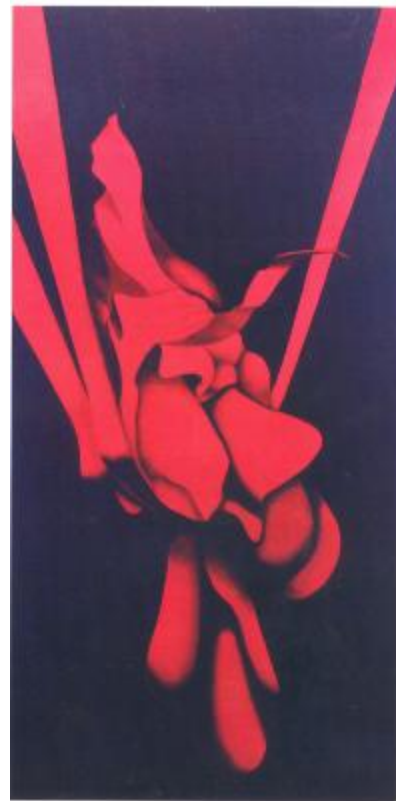
Colgado 40" x 30" óleo sobre lienzo Hector Rabal