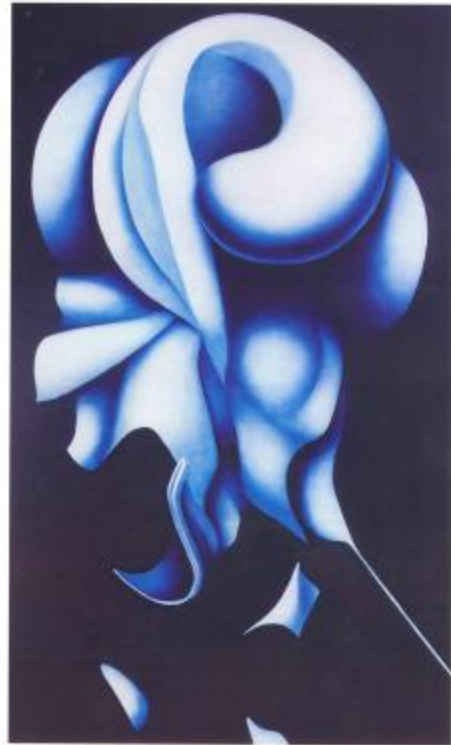
La Ascensión 60" x 36" óleo sobre lienzo Hector Rabal