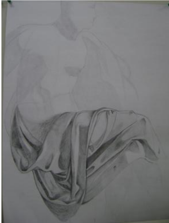
Dibujo de Nashma Rodríguez'09