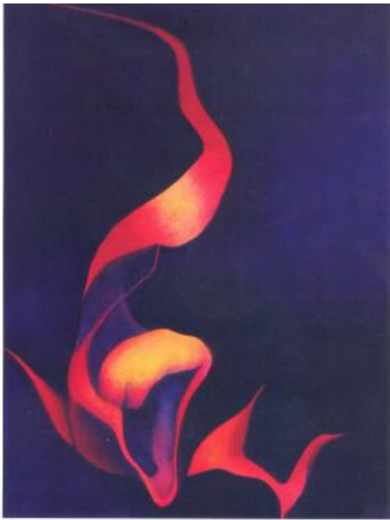
El Dragón 24" x 18" óleo sobre lienzo Hector Rabal