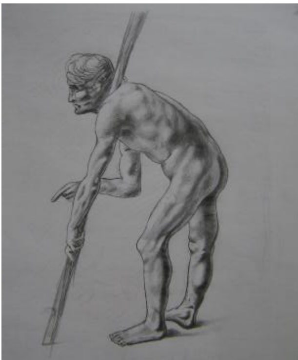
Dibujo de Gustavo Stuart'09