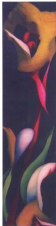
Retoño 47" x 12" óleo sobre lienzo Hector Rabal